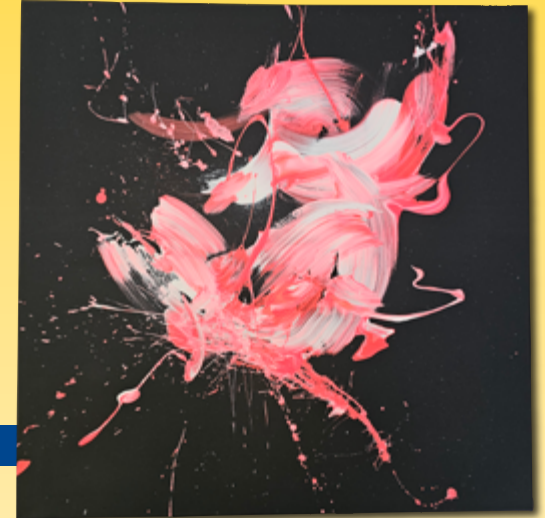
ID 17 - AP € 250 €

Allbright Artworks steht für das Leuchten in den Augen des Betrachters, für Helligkeit und positive Energie. Jedes Werk entsteht spontan und teils mit ungewöhnlichen Werkzeugen. In mehreren Schichten werden Acrylfarben und andere Materialien aufgetragen, sodass es beim Betrachten immer wieder etwas Neues zu entdecken gibt - Allbright Artworks steht für unkonventionelle Kunst.