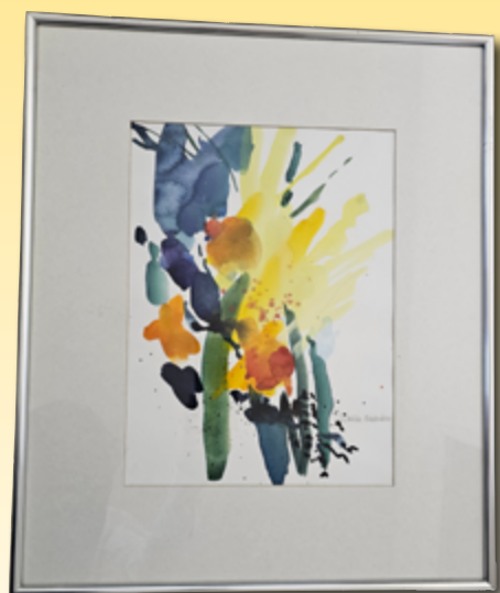
ID 26 - AP € 100 €