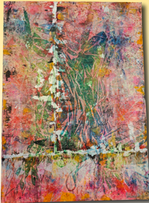
ID 12 - AP € 40 €