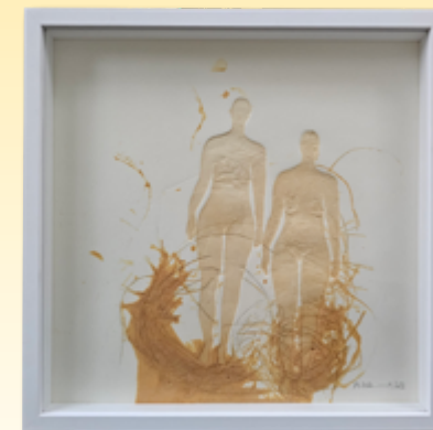
ID 25 - AP € 100 €