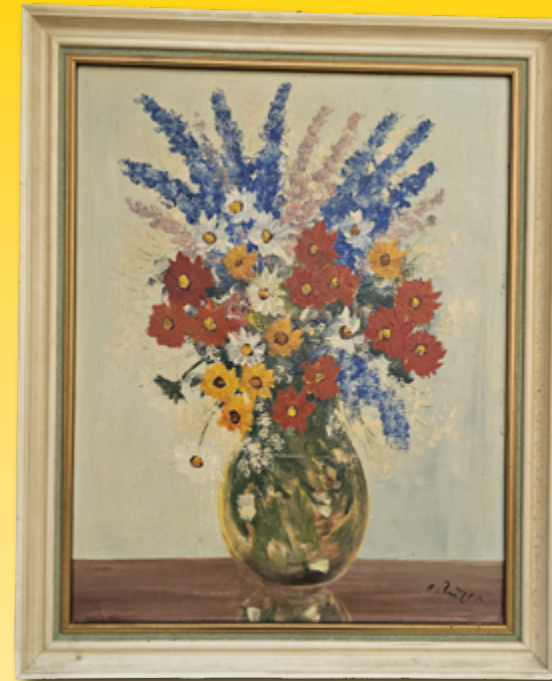
ID 31 - AP € 50 €