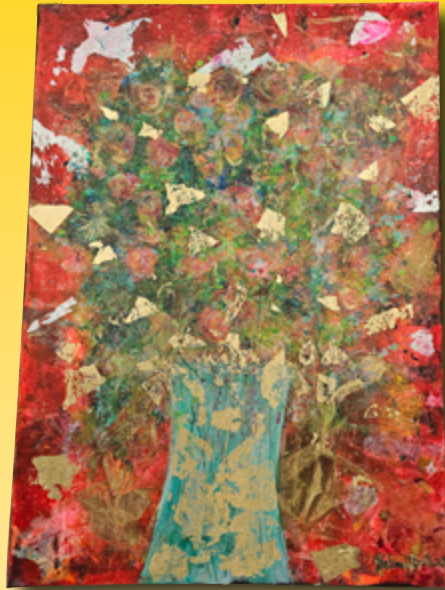
ID 11 - AP € 40 €