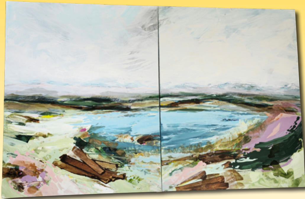
ID 1 - AP € 950 €

Mehr zur Künstlerin: www.bettinahobel.de