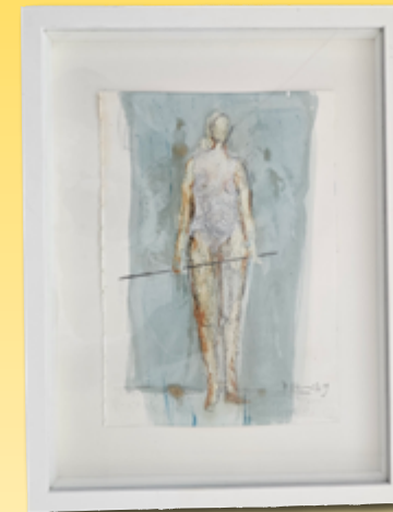
ID 23 - AP € 100 €