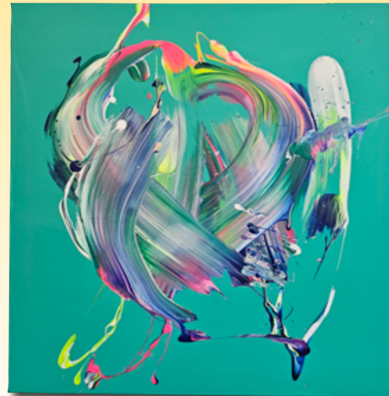
ID 18 - AP € 250 €