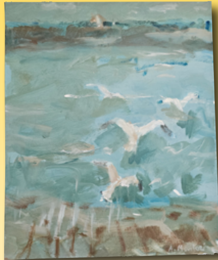
ID 6 - AP € 80 €