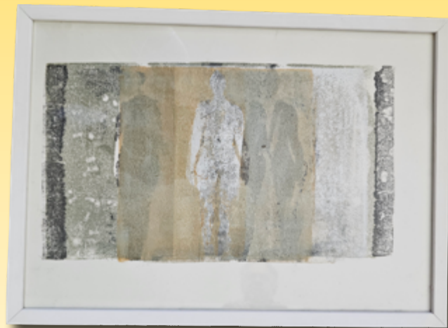
ID 22 - AP € 100 €