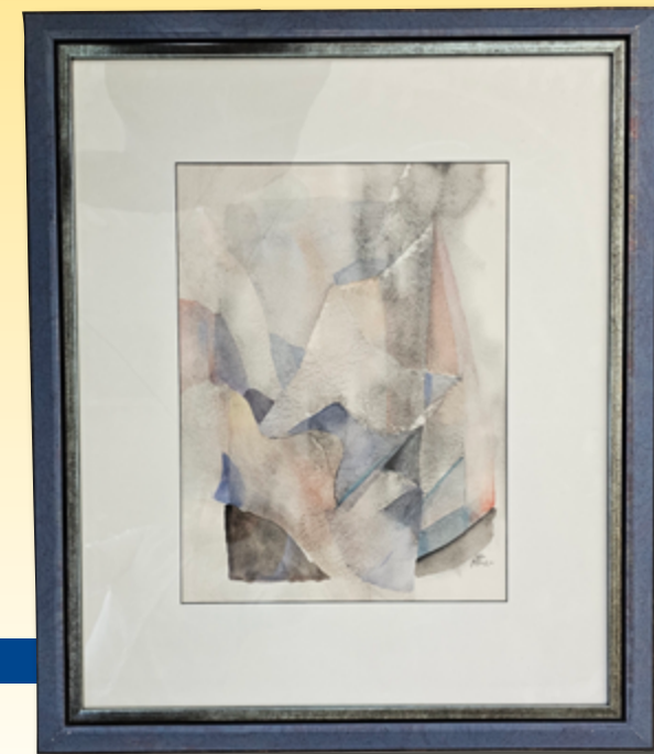
ID 32 - AP € 75 €