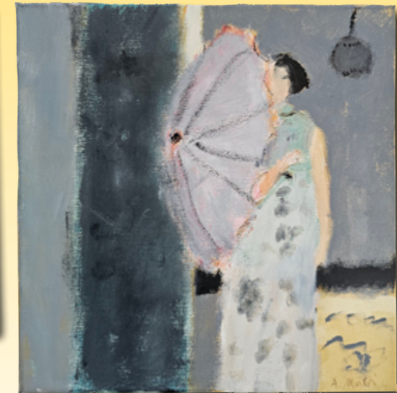
ID 9 - AP € 80 €