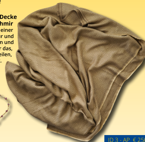
ID 3 - AP € 250 €

Das kostbare Stück stammt aus einer kleinen, familiengeführten Manufaktur und vereint Handwerkskunst, Tradition und wohlthuende Wärme – ein Sinnbild für das, worum es bei dieser Aktion geht: Teilen, was gut tut.