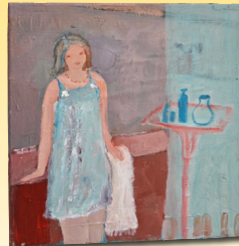
ID 8 - AP € 80 €

Etwas Neues erschaffen ist ein Sprung in schöne Träume.“