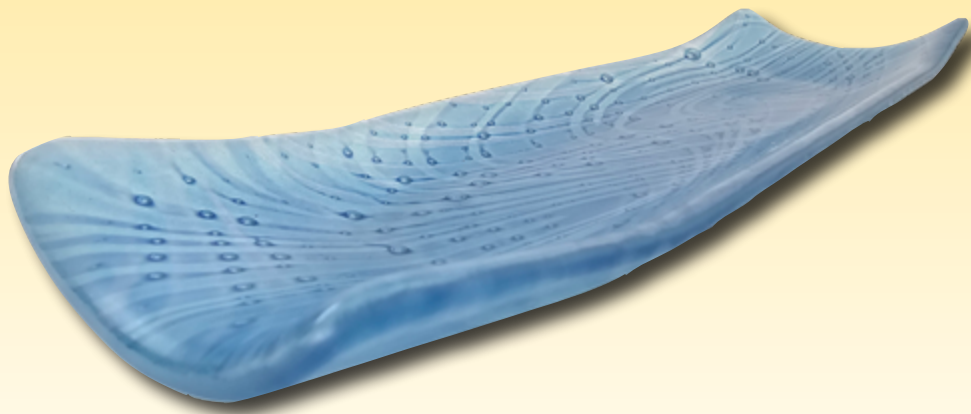
ID 34 - AP € 160 €

In einer großen Zahl von öffentlichen Sammlungen finden sich ihre Arbeiten (Europäisches Museum für Modernes Glas, Coburg, Musée de design et d'arts appliqués contemporains, Lausanne und Glasmuseum Lobmeyr-Sammlungen, Wien).