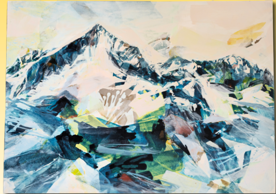
ID 2 - AP € 650 €