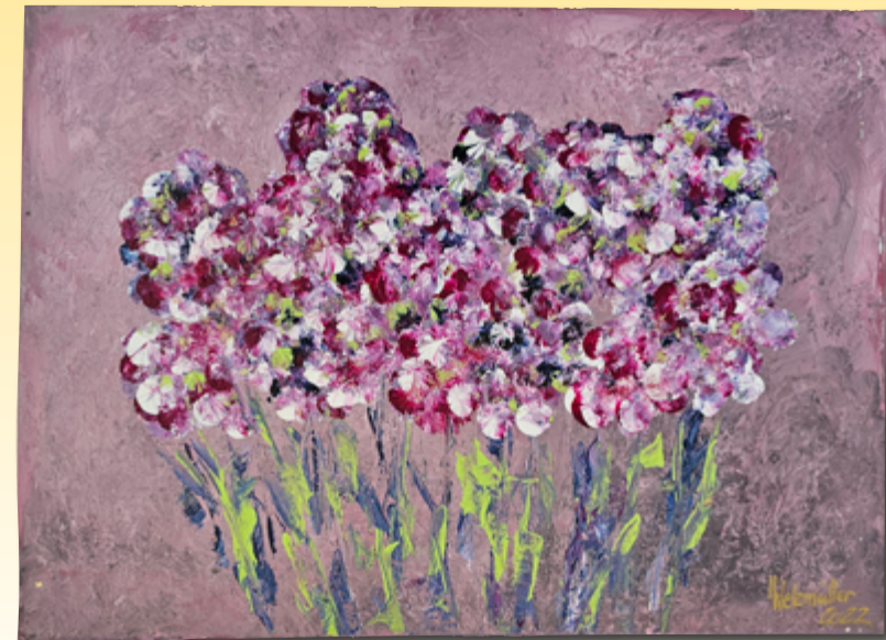
ID 14 - AP € 40 €