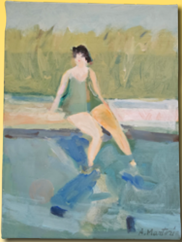
ID 5 - AP € 80 €

Ihr Motto: Kunst als ein Traumbild, als eine geistige Reise. Aus dieser Quelle erwächst immer wieder das Thema ihrer Aquarelle „Posie in Farbe“, welches grundsätzlich über allen ihren Werken steht.