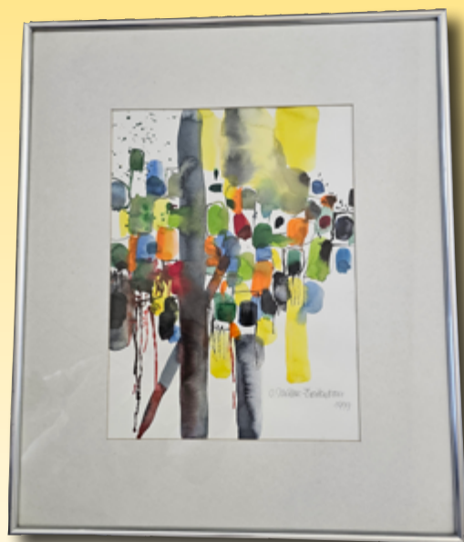
ID 27 - AP € 100 €