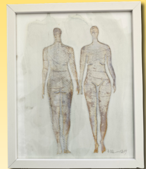
ID 24 - AP € 100 €