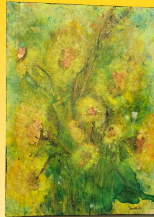
ID 13 - AP € 40 €