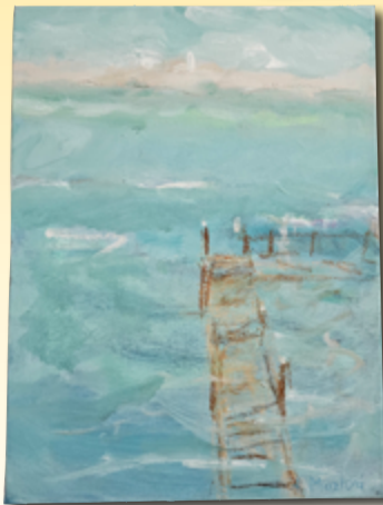
ID 7 - AP € 80 €

„Große Formate in Acrylfarben waren der neue Anfang in der Ausstellung 2015 in Naumburg. Aber auch kleine Bilder kommen wieder... Meine letzten Ausstellungen standen alle unter dem Titel »Die Frauen«.