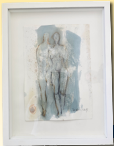
ID 21 - AP € 100 €